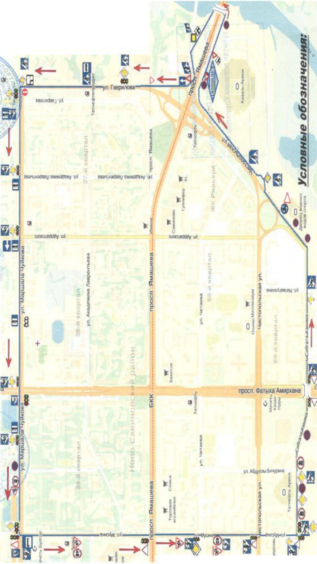
СХЕМА УЧЕБНОГО МАРШРУТА № 2

Период с «01» сентября 2018 г. до «31» декабря 2018 г. М.П.